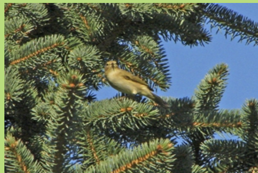
Świstunka (wrzesień 2007)