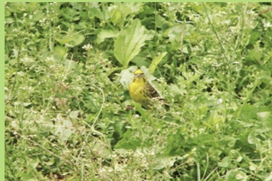
Trznadel (czerwiec 2007)