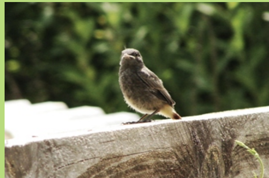
Młody kopciuszek (lipiec 2007)