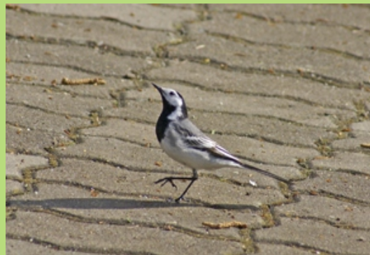
Pliszka siwa (maj 2008)