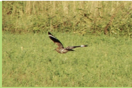
Dudek w okolicach domu J. Pochyły (sierpień 2007)

W okolicach łąk i pastwisk pojawia się dzierzba gąsiorek ( Lanius collurio ), ptak stosunkowo łatwy do obserwacji dzięki zwyczajowi przesiadywania na eksponowanych miejscach- ogrodzeniach, belach siana czy samotnych drzewkach. Ptak ten znany jest z interesującego zwyczaju- często robi zapasy nabijając upolowane owady na ciernie lub ostre gałązki.