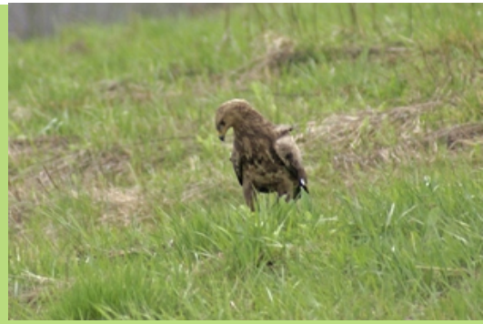
Myszołów polujący na łące (kwiecień 2008)

Pojedyncze szczygły ( Carduelis carduelis ) można było spotkać w czerwcu i lipcu 2007 r. przy drodze do Studennego, a całe ich stada krążyły po okolicy w sierpniu. Arcysympatyczne i muzyczne rudziki ( Erithacus rubecula ) zamieszkiwały latem 2007 r. w pobliżu baru. Tam spotkać można było także kowalika ( Sitta europaea ), który na miejsce polowania wybrał sobie pewnego razu betonowy przepust w rowie. Demonstrując swe niezwykle akrobatyczne umiejętności (jest jedynym ptakiem w