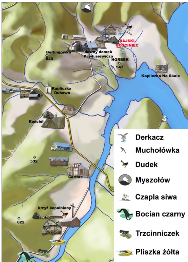
MAPA WYSTĘPOWANIA NIEKTÓRYCH PTAKÓW (2007-2008)