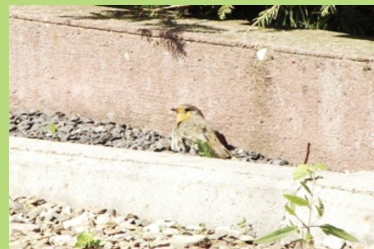
Rudzik podczas kąpieli słonecznej (czerwiec 2007)