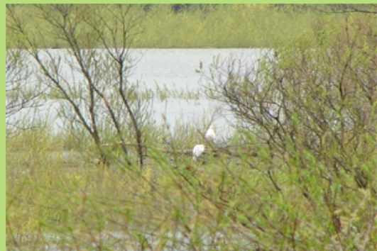
Czaple białe na rozlewiskach jeziora (maj 2008)