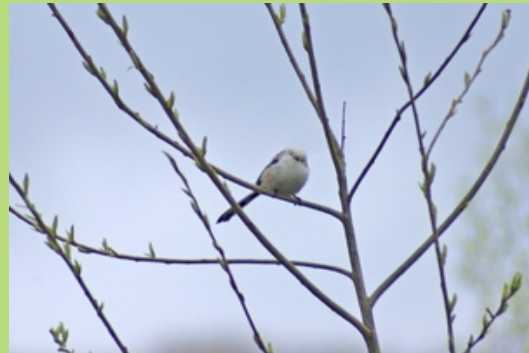
Ranuszek (kwiecień 2008)