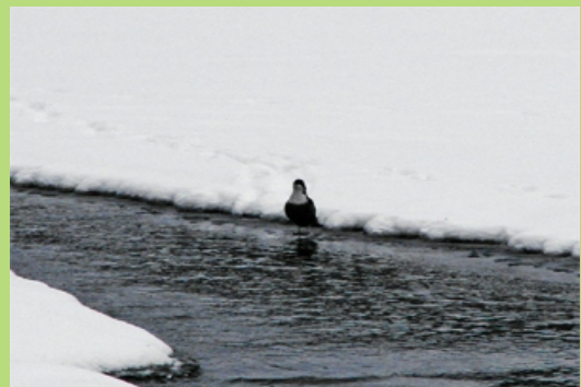
Pluszcz nad Sanem (styczeń 2008)