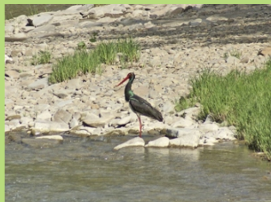
Bocian czarny polujący nad Sanem (maj 2008)