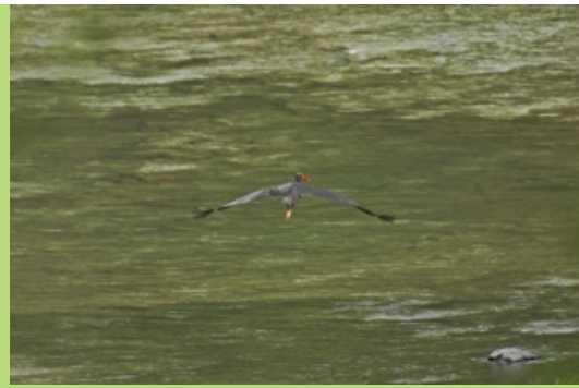
Bocian czarny przelatujący nad Sanem (maj 2008)

Na łąkach w Rajskim występuje niezwykła ptasia rzadkość- chruścieł derkacz ( Crex crex ). Wzmiankował go Adam Mickiewicz w „Panu Tadeuszu: „Już trzykroć wrzasnął derkacz, pierwszy skrzypak łąki”. Z wyglądu przypomina nieco kuropatkę, jest jednak od niej mniejszy i smuklejszy. Łatwiej go jednak usłyszeć, niż zobaczyć, gdyż preferuje skryty tryb życia. Jego głos ma moc porównywalną z silnikiem ciężarówki i z niczym nie można go pomylić. Można go usłyszeć z kilkuset metrów wieczorami, nocami, a czasem także w pogodne dni od maja do połowy lipca. Wiosną 2008 derka-