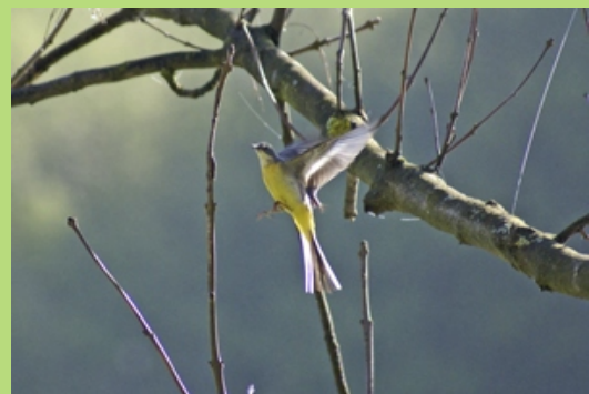
Pliszka żółta w locie (maj 2008)