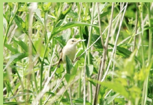
Trzcinniczek na rudbekiach (czerwiec 2007)