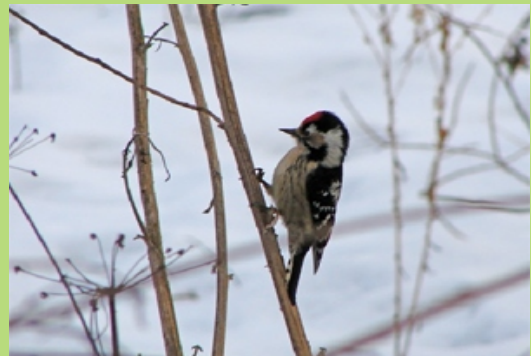
Dzięciołek w okolicach Berlingówki (styczeń 2008)