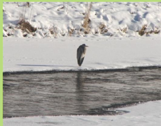
Czapla siwa czatująca nad zamrzniętym Sanem (styczeń 2008)