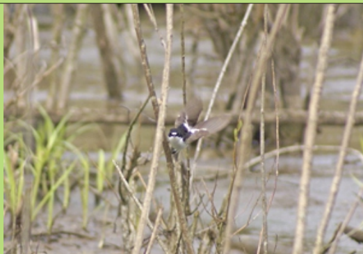
Muchołówka białoszyja (Kwiecień 2008)