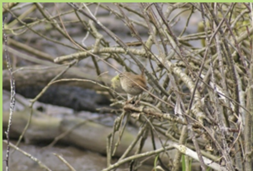
Strzyżyk (Kwiecień 2008)