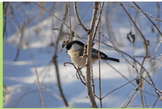
Czarnogłówka (styczeń 2008)