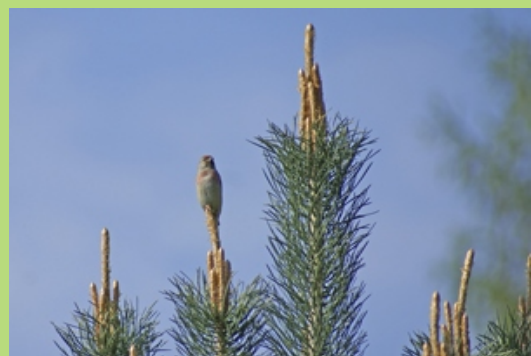
Makolągwa w ogródku przy Rajskim Gościńcu (maj 2008)