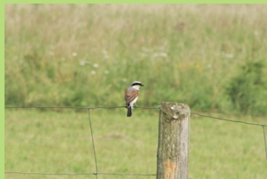
Gąsiorek- samiec na czatach (lipiec 2007)