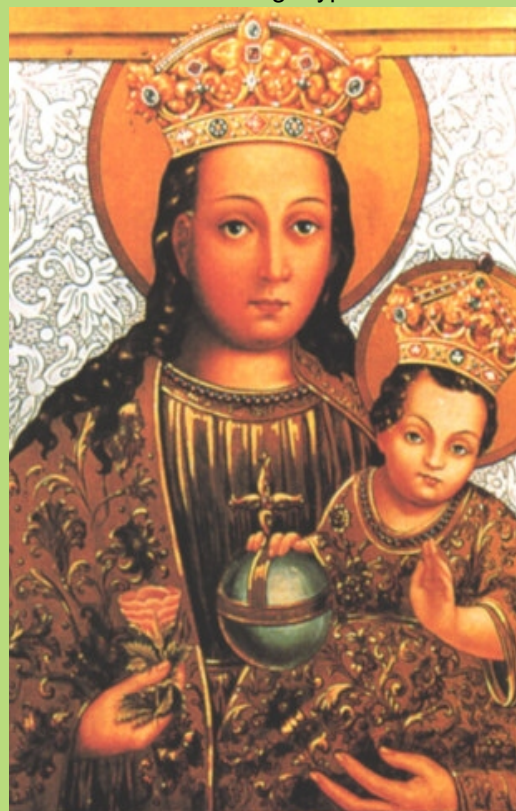
Matka Boża Tuchowska

Jest to jedna z najstarszych zachowanych ikon ruskich tego typu.