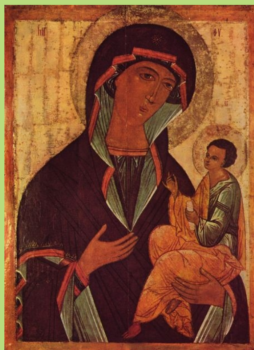
Hodegetria z Nowogrodu (powstała około 1380 r.)