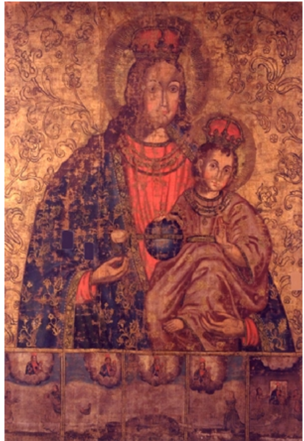
Obraz Matki Bożej z Dzieciątkiem pochodzący z Rajskiego

W arto zatrzymać się chwilę przy tej interesującej uwadze, którą znajdujemy w opisie pozyskania Rajskiej Madonny w inwentarzu kościoła w Hoczwi. Może ona wskazywać, że Rajskie było na przełomie XVII/XVIII wieku jednym z gniazd beskidników (zwanych czasem także z węgierska tołhajami), czyli zbójników karpaccich łupiących karawany kupieckie, wsie, dwory, cerkwie i kościoły. W okresie, kiedy w Rajskim rozwijał się kult świętego obrazu, namnożyło się w Bieszczadach szczególnie wielu złoczyńców, a ich napady stanowiły prawdziwy dopust boży. XVII w. przyniósł ze sobą liczne zjawiska kryzysowe w Rzeczypospolitej. Wojny, przemarsze wojsk, epidemie, najazdy Tatarów zaburzyły ład społeczny, demoralizowały, skłaniały do niecznych czynów. Według pewnych relacji, z zawodowych beskidników składała się niemal cała „ludność z Bieszczadu” 6 . O uporczywe zbójnictwo oskarżano liczne wioski, w tym położoną nieopodal Polanę. 7 Wiadomo, że nadgraniczni węgierscy rabusie, wspierani przez tamtejsze rody szlacheckie trzymali po polskiej stronie przestępcze spółki z chłopami. 8 Niestety, zły przykład szedł z góry, od ówczesnych elit społecznych. Niektórzy z polskich szlachciców brali czynny udział w bandyckim procederze: „zdarzało się często, że bandzie zbójckiej przewodził szlachcic